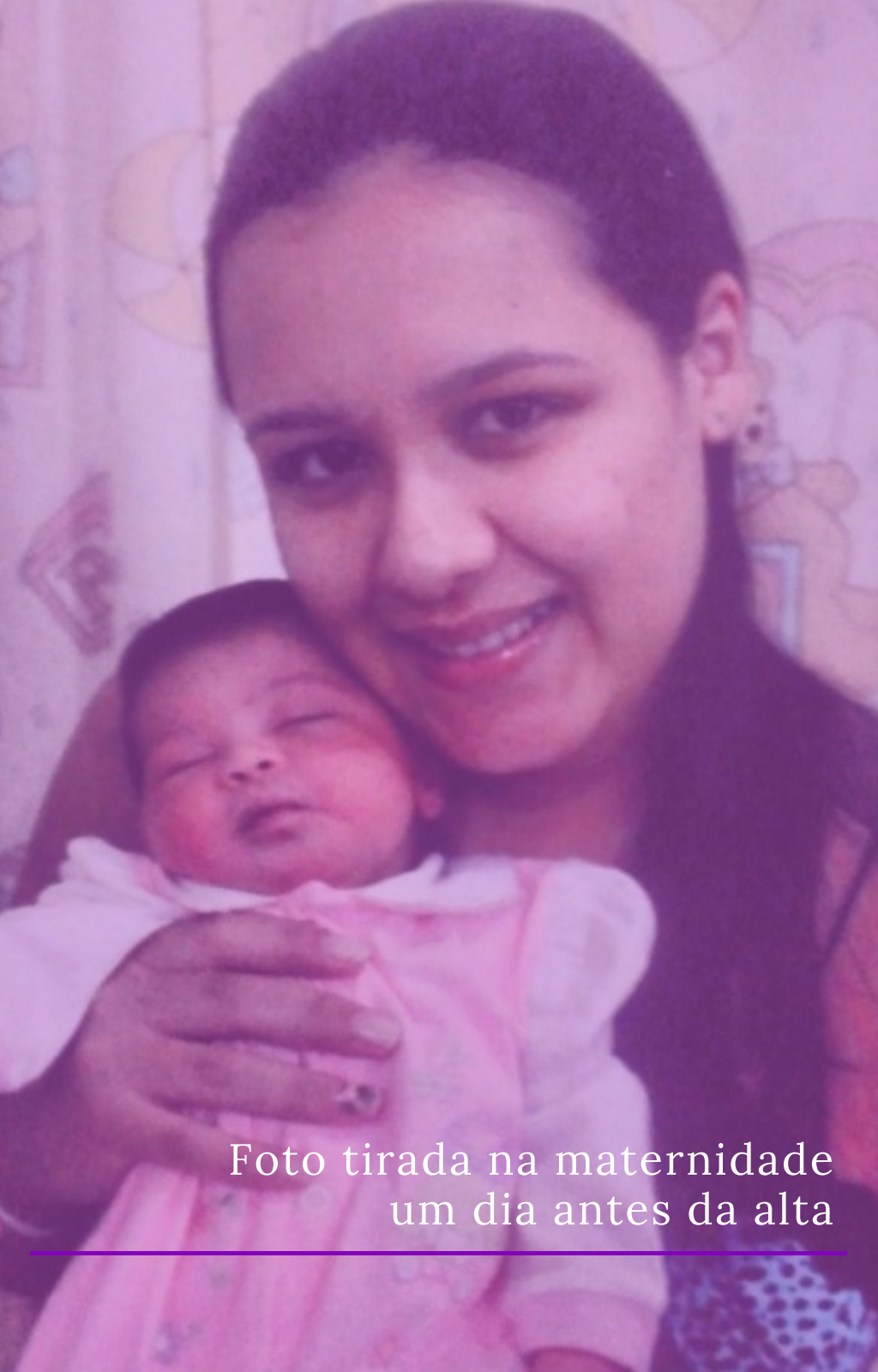
Foto tirada na maternidade um dia antes da alta